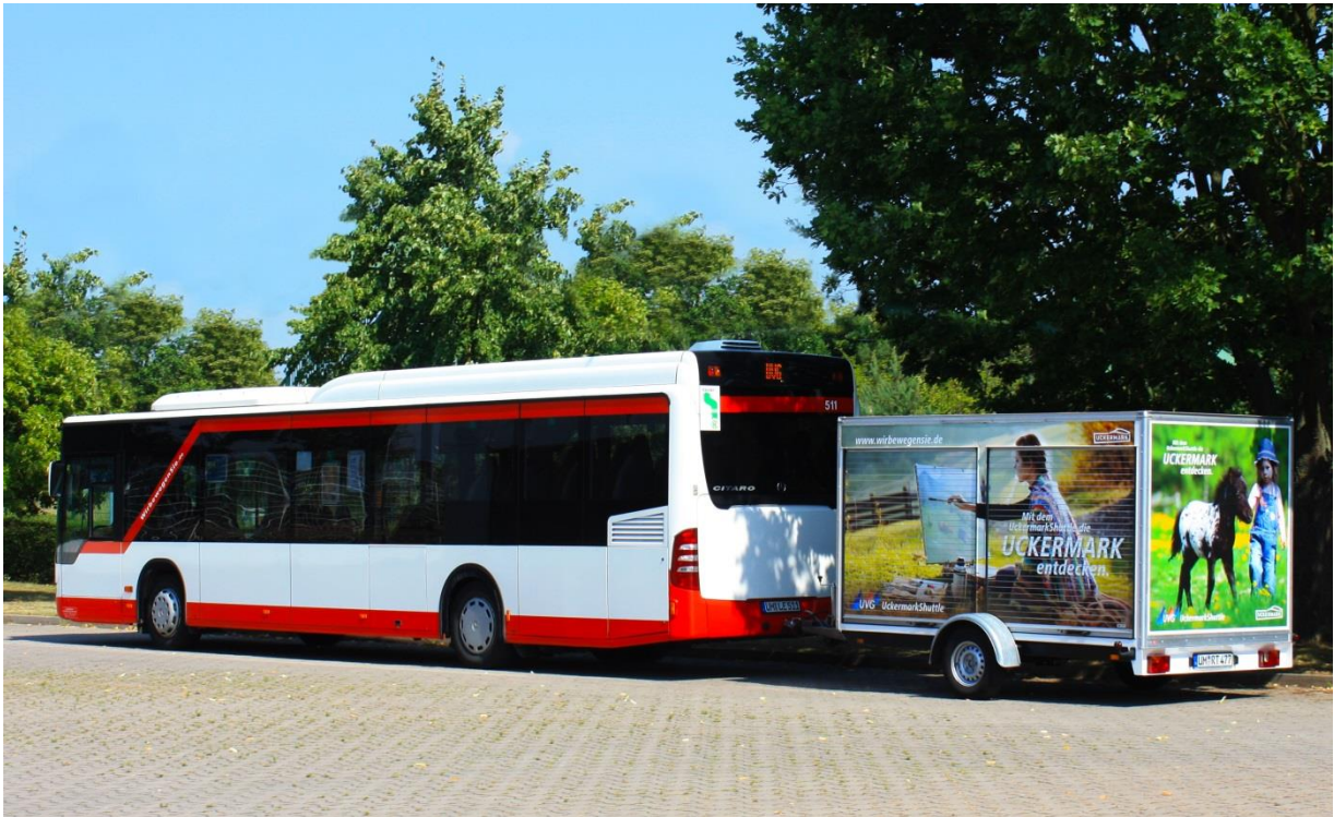
Foto: UckermarkShuttle mit Anhänger

Besonders praktisch: In der Zeit vom 01.04. – 31.10.2017 befindet sich ein Fahrradträger für bis zu 4 Fahrräder am UckermarkShuttle und die Fahrradmitnahme mit dem Bus ist somit problemlos möglich. Sollte einmal mehr Platz benötigt werden, kann man dies vorher unter 03332 442 755 anmelden und wir hängen einen Fahrradanhänger für ca. 10 Fahrräder an den Shuttle.